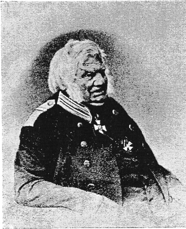
А. П. Ермоловъ. Съ литографіи Бореля (№ 21).