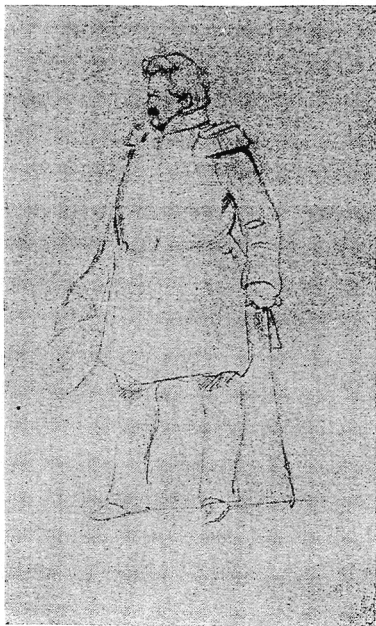
А. П. Ермоловъ. Рисунокъ карандашомъ, неизвестнаго художника (№ 12).