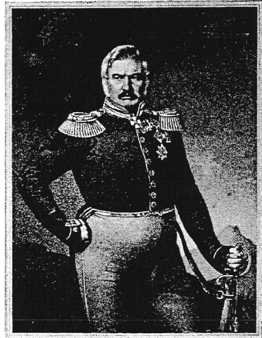
А. П. Ермоловъ. Съ литографіи по оригиналу П. Захарова (№ 22).

lith. Литогр. В. Бахманъ въ Москвѣ, съ автографомъ «Ермоловъ» выш. — 25 ст., шир. — 23 ст.