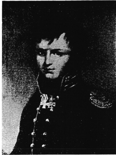
А. П. Ермоловъ въ молодости съ картины неизвѣстнаго художника (№ 3).

10. — en face, чернымъ карандашомъ, ман. Орловскаго, — находится у А. С. Ермолова.