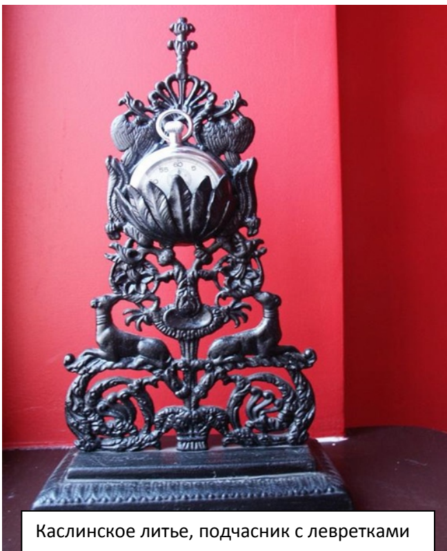
Каслинское литье, подчасник с левретками

Конечно, получали заслуженные награды – Малая серебряная медаль Мануфактурной выставки в Санкт-Петербурге (1860), Большая золотая медаль Всероссийской мануфактурной выставки в Санкт-Петербурге (1867), Большая золотая медаль Политехнической выставки в Москве (1870).