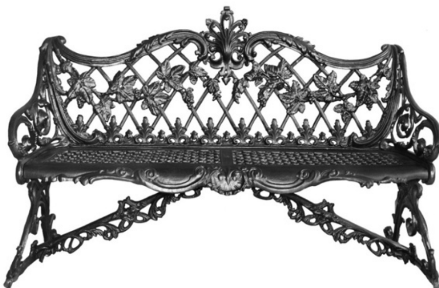
Каслинское литье, скамейка «Виноградная лоза»