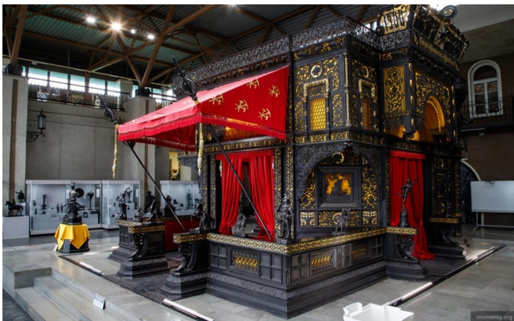
Каслинский ажурный чугунный павильон-дворец, 1900 г.

Главным элементом павильона являлась скульптура Н. А. Лаврецкого «Россия», установленная перед центральным входом в павильон. Скульптура изображала Россию в виде прекрасной и сильной молодой женщины-воительницы в древнерусских ратных доспехах: кольчуга, шлем, меч в правой руке и щит в левой.