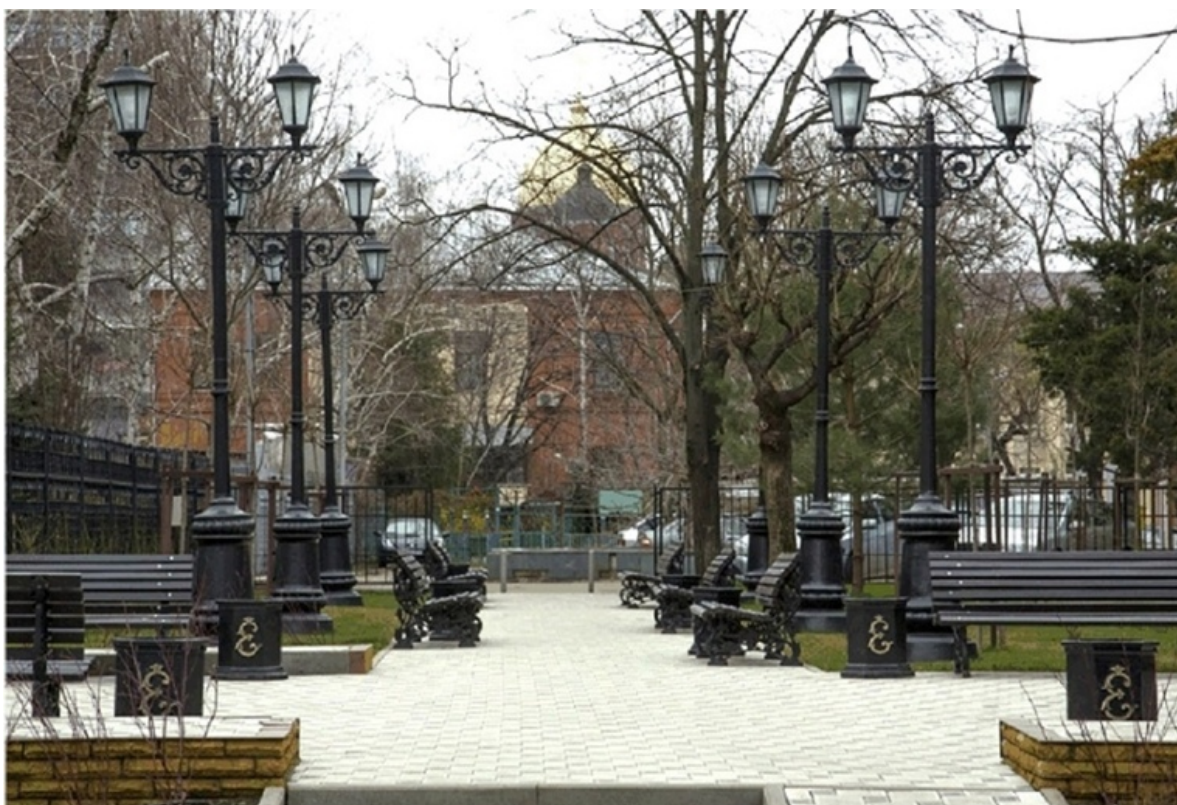
Каслинское литье, крупные парковые формы