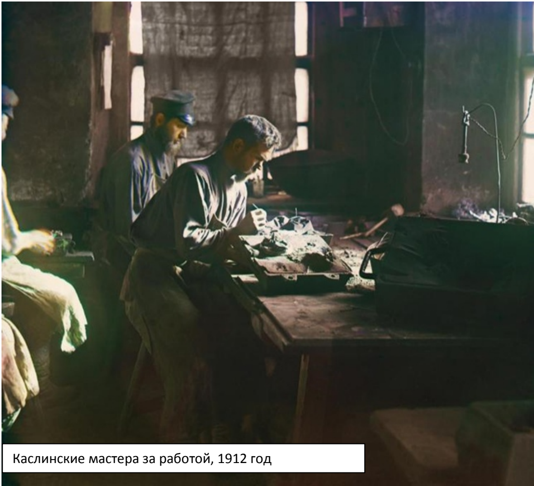
Каслинские мастера за работой, 1912 год