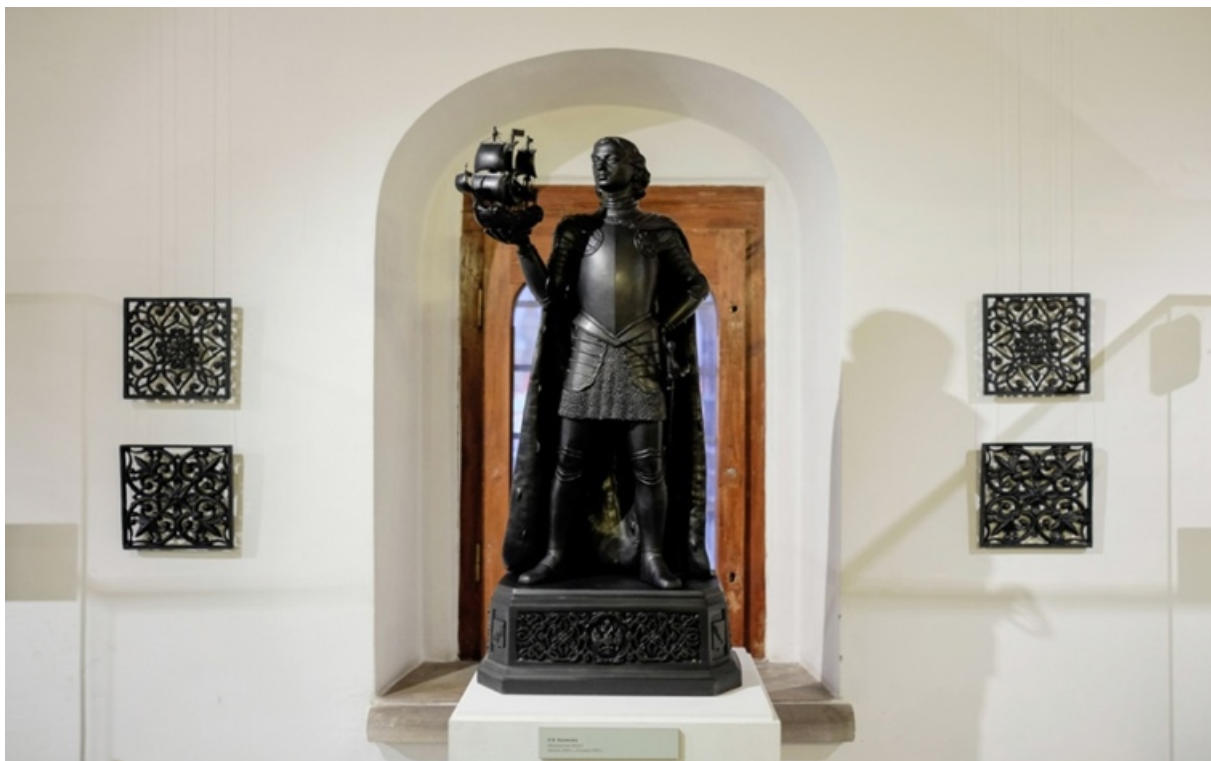
Скульптура Петра I. Музей каслинского чугунного литья в г. Касли