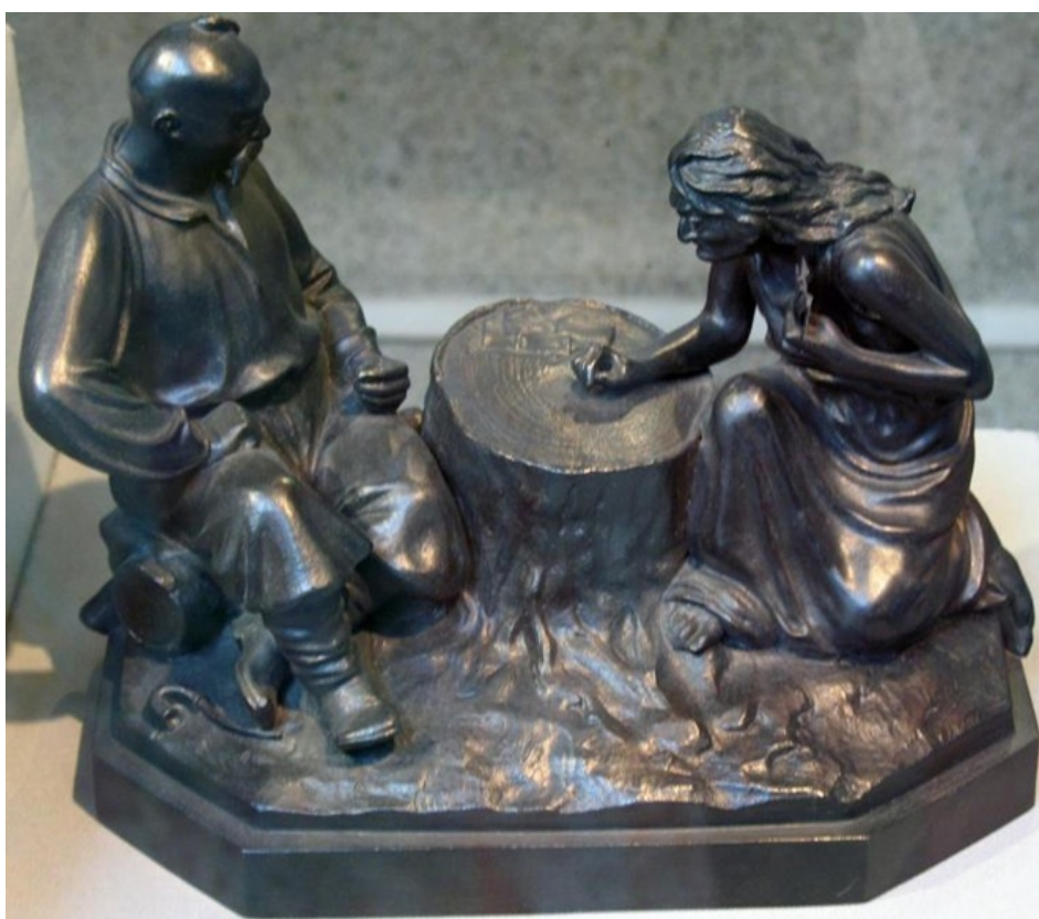
Скульптура «Запорожский казак и гадалка»

К концу XIX века художественное литье стало особенно модным. По всему миру проходили многочисленные выставки, на которых сотни мастеров