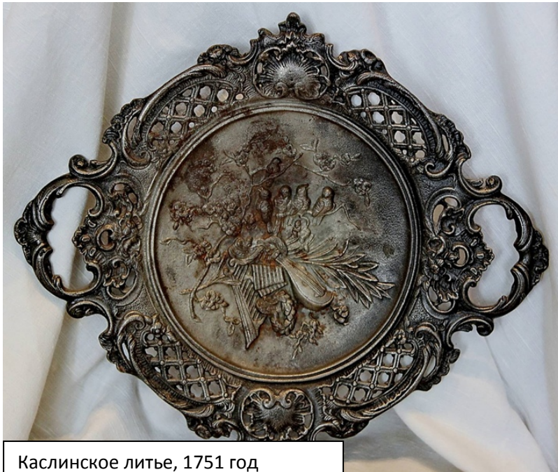
Каслинское литье, 1751 год

Место было выбрано богатое чугуном, уникальным качественным формовочным песком, а также древесиной для производства угля. В то время фигурное литье с переменным успехом пытались освоить на каждом втором железодельном заводе Урала, но каслинцам повезло чуть больше других: местный чугун