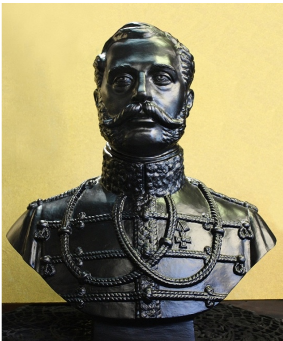
Бюст Александра II