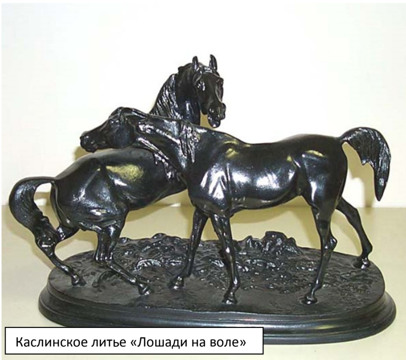
Каслинское литье «Лошади на воле»

Благодаря умелому управлению завод каслинских чугунных изделий быстро обрел всемирную славу, численность изготовления литья из чугуна возросла в несколько раз. В 1823 году управляющим назначили Григория Зотова. Его считают основоположником каслинского художественного литейного промысла. Именно Зотов из Германии привез на мануфактуру технологию «отливки в формах», которую наши мастера, по традиции, усовершенствовали и приспособили для своих нужд.