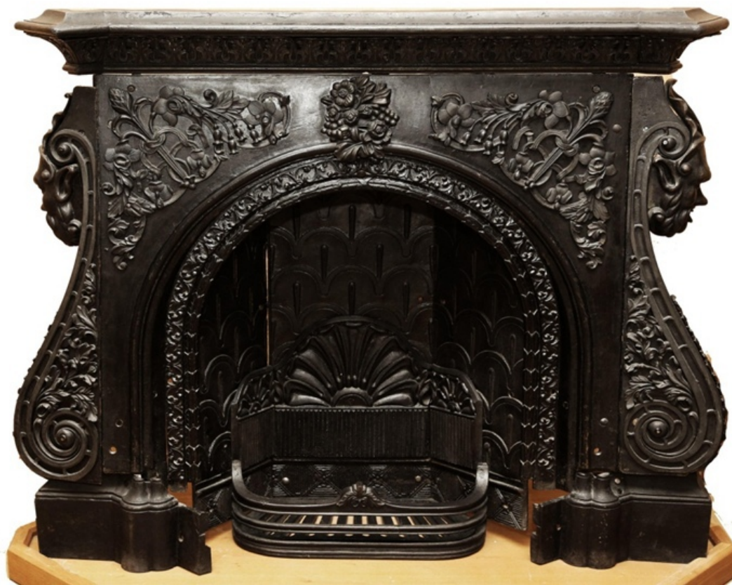
Каслинское литье, камин