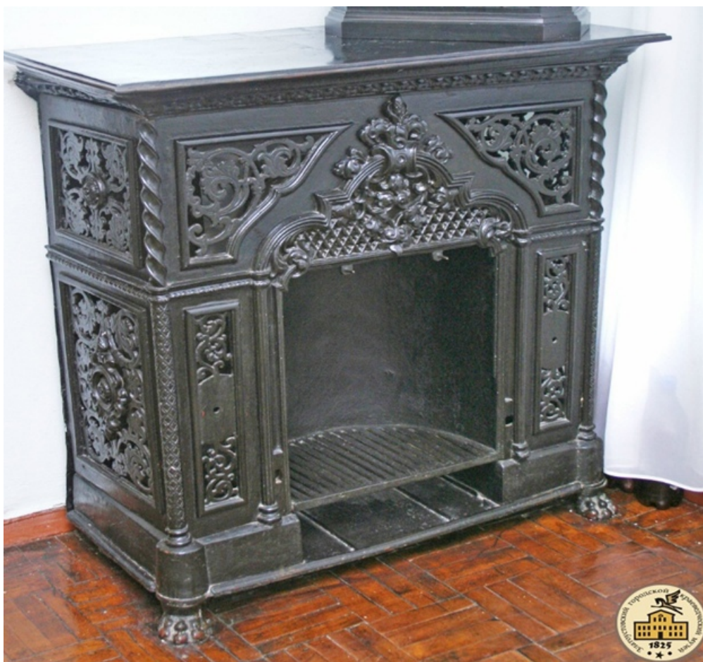
Демидовская печь-камин, старинное каслинское литье

Сегодня, как и ранее, завод Каслинского чугунного литья выпускает не только мелкие предметы искусства и сувениры, но также крупногабаритные формы – фонари, памятники, парковые сооружения (скамейки и урны), садовую кованую мебель, камины и др.